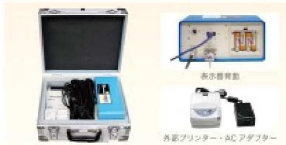
表示器・付属品 (運搬ケース収納時)