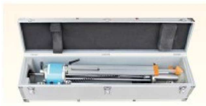
本体 (運搬ケース収納時)

社団法人日本材料学会 平成 29 年 8 月 21 日 技術評価証第 1004 号