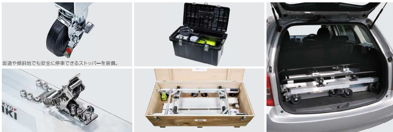
坂道や傾斜地でも安全に停車できるストッパーを装備。